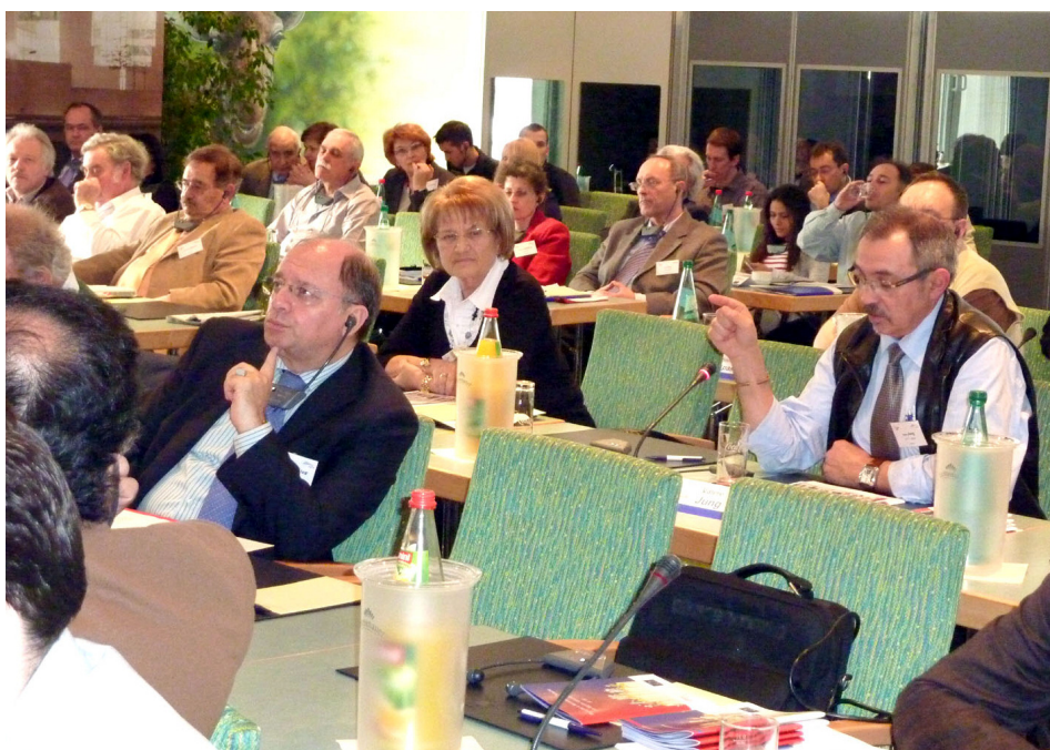
Assemblée plénière lors de la conférence de clôture du projet EZA sur la crise économique et financière qui s'est tenue à Berlin sur le thème « La dimension sociale de la crise économique, financière et de l'emploi : ses répercussions et défis pour les organisations de travailleurs ? »

Après les conférences régionales organisées dans le cadre de ce projet et les conclusions qui en ont été tirées, il s'est tenu en mars à Berlin la conférence de clôture sur le thème « La dimension sociale de la crise économique, financière et de l'emploi : ses répercussions et défis pour les organisations de travailleurs ? » et ce sont maintenant les conclusions de tout ce projet qui sont présentées.