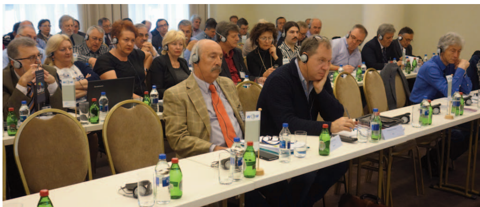
Participantes del seminario “Los retos de la economía de mercado ecosocial” de CNV (Christelijk Nationaal Vakverbond) en abril de 2016 en Belgrado, República de Serbia

Esta economía mata”, clamaba el Papa Francisco en su exhortación apostólica “Evangelii Gaudium”. A EZA no le dejaron indiferentes esas palabras y considera su tarea reflexionar sobre lo que se debe hacer para reducir las consecuencias dramáticas de nuestras economías sobre el medio ambiente. En este contexto, cobran especial relevancia los cinco seminarios que se organizan dentro del marco de la coordinación de proyectos del ejercicio 2016/2017 sobre el tema “puestos de trabajo verdes”.