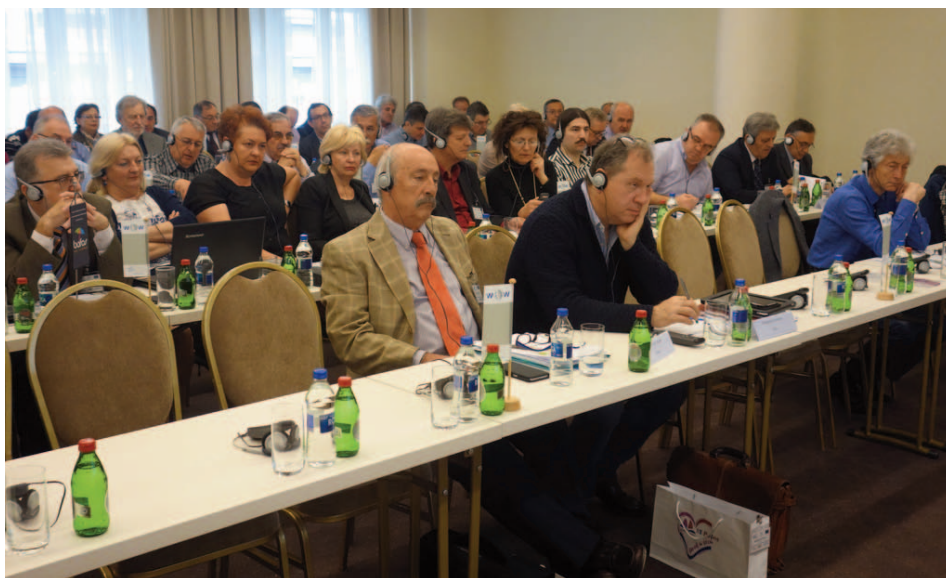
Participants au séminaire « Les défis de l'économie de marché éco-sociale » de la CNV (Fédération nationale des syndicats chrétiens) en avril 2016 à Belgrade, en République serbe

rope », organisé par le KAB Deutschlands (Mouvement des travailleurs catholiques d'Allemagne) à Linz, en août/septembre 2016