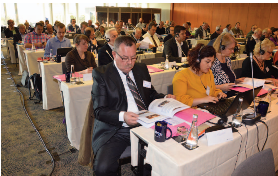
Participants au séminaire de lancement de l'EZA qui s'est tenu à Marseille en décembre 2016

Quelle signification les valeurs ont-elles pour les organisations de travailleurs dans une Europe constituée de pays très différents et de cultures très diverses ? Telle était la question cruciale du séminaire de lancement de l'EZA qui s'est tenu les 1er et 2 décembre 2016 à Marseille en collaboration avec la CFTC (Confédération Française des Travailleurs Chrétiens), avec le soutien de l'Union européenne.