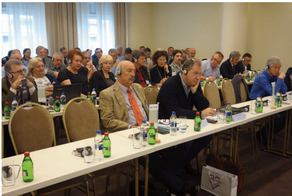
Sudionice i sudionici seminara „Izazovi ekosocijalne ekonomije“ u organizaciji CNV-a (Christeljik Nationaal Vakverbond) u aprilu 2016. u Beogradu, Republika Srbija